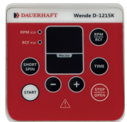
Interfaz y pantalla