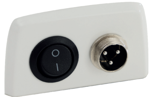
Interruptor y puerto de alimentación