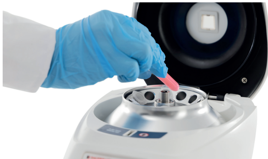
Rotor para 12 microtubos