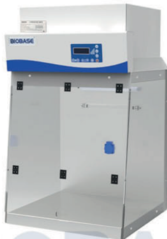
BBS-V600 & BYKG-VIII