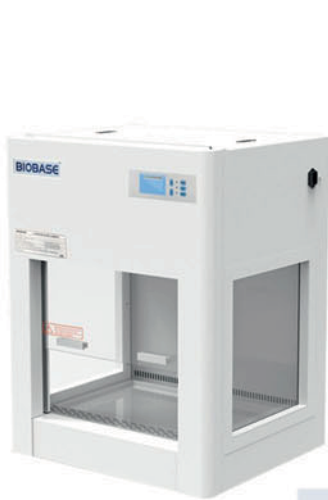
BBS-V500 & BYKG-VII