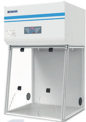
BBS-V700 & BYKG-IX BYKG-X & BYKG-XII

Las campanas para compuestos pueden ser de dos tipos: