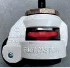
Ruedas de base niveladoras