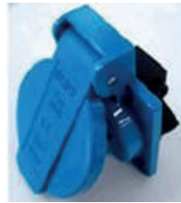
Tomacorrientes a prueba de salpicaduras

El gabinete de flujo laminar es un banco de trabajo con su propio suministro de aire filtrado. Proporciona protección al producto, garantizando que el trabajo en el banco sólo se expone al aire filtrado por el filtro HEPA.