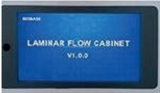
Pantalla LED digital