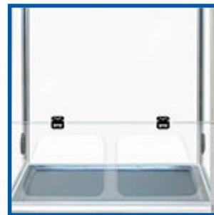
Ventana acrílica frontal rebatible con función de parada libre