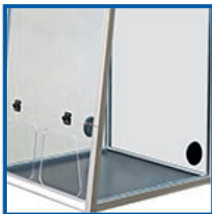
Ventanas laterales y traseras que maximizan la luz y la visibilidad, para un entorno de trabajo amplio e iluminado