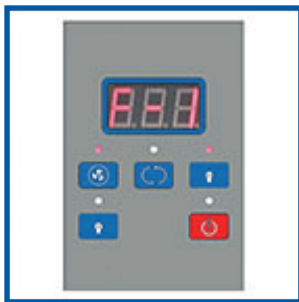
Pantalla LED Digital