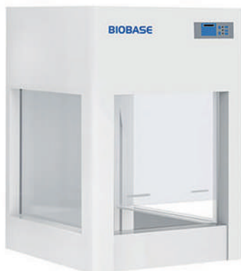
BBS-V500 & BYKG-VII