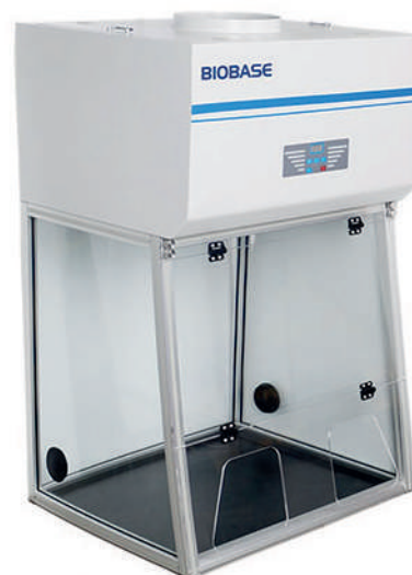
BBS-V700 & BYKG-IX BYKG-X & BYKG-XII

Las campanas para compuestos pueden ser de dos tipos: