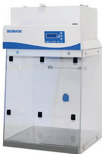
BBS-V600 & BYKG-VIII