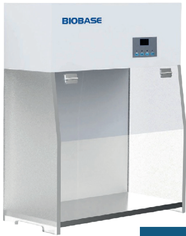
BYKG-I y II